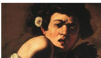
CARAVAGGIO ragazzo morso da un ramarro

Visita guidata alla mostra presso il Museo d'Arte della città di Ravenna.