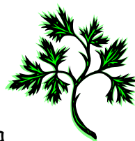
Frittatine di Vitalba

Sbattere leggermente le uova, salare e pepare. Incorporare due cucchiari di latte e un po' di parmigiano. Aggiungere gli asparagi sminuzzati. Mescolare delicatamente. Versare a cucchiaiate in olio bollente.