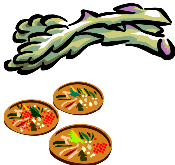
Frittatine di Asparagi

Sbattere leggermente le uova, salare e pepare. Incorporare due cucchiari di latte e un po' di parmigiano. Aggiungere gli asparagi sminuzzati. Mescolare delicatamente. Versare a cucchiaiate in olio bollente.